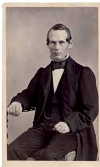
Figur 1. Anders Ångström.