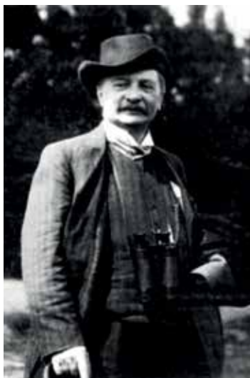
Figur 4. Porträtt av Johannes (Janne) Robert Rydberg

I motsats till Anders Ångström, som var experimentalist, var Johannes (Janne) Rydberg (se figur 4) mer teoretiskt lagd. Han disputerade först med en matematisk avhandling och blev docent i matematik år 1879. Det var först ett par år senare som han lade fram ett arbete om friktionselektricitet för en docentur i fysik, som han sedermera också fick år 1882. När Rydbergs intresse för fysiken väcktes hade Anders Ångström redan gått bort och kopplingen mellan de båda kommer framförallt av att Rydberg använde Ångströms mätningar