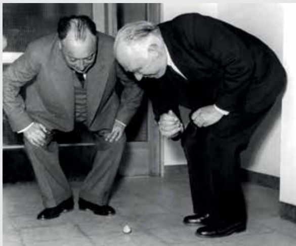
De två Nobelpristagarna Niels Bohr och Wolfgang Pauli studerar en så kallad "TippeTop" i Lund.

1954 arrangerades en konferens i Lund med anledning av Janne Rydbergs 100-årsjubileum. Bland deltagarna kan speciellt noteras två fysiker som redan vid tillfället för konferensen hade fått Nobelpriset i fysik (ytterligare 4 av konferensdeltagarna fick senare Nobelpris i fysik och en i kemi). Dessa två var Niels Bohr och Wolfgang Pauli. Niels Bohr blev den som till slut lyckades förklara varför Rydbergs ekvation är korrekt och Wolfgang Pauli kunde med sin uteslutningsprincip förklara det periodiska systemets uppbyggnad, en periodicitet som hade sysselsatt Rydberg hela hans yrkesverksamma liv.