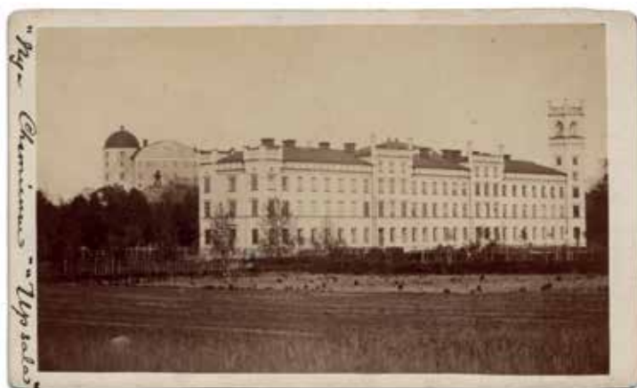
Figur 2 Chemicum (numera Philologicum). Anders Ångströms tjänstebostad och det fysiska kabinettet låg på tredje våningen, men Ångström arbetade även i tornet.

avhandling inom optik och antogs som docent i fysik. Ångström var dock verksam inom flera vetenskapliga områden och var bland annat anställd som adjunkt vid Stockholms observatorium och som examinator i matematik vid studentexamen. Han gjorde även studieresor utanför Sverige; bland annat fick han stipendium för att kunna resa till observatoriet Bogenhausen i München och lära sig mäta jordmagnetismen och störningar i magnetfältet. På vägen tillbaka till Sverige mätte han upp jordmagnetismen i bland annat Paris, Bryssel, Göttingen och Köpenhamn, och han hade därefter under ett antal somrar ambitionen att systematiskt kartlägga de jordmagnetiska förhållandena i hela Sverige.