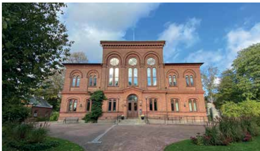
Figur 5. Huset som Fysiska institutionen flyttade till 1885.

Det var ett mäktigt arbete som han tog sig an, men det ledde till slut fram till en formel som beskriver hur spektrallinjerna ser ut i flera olika ämnen och som Niels Bohr sedan kunde förklara med hjälp av kvantmekaniken.