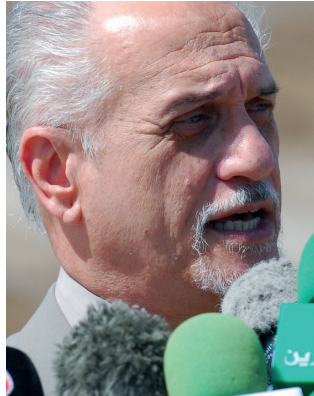
Figur 6: Nya presidenten för Pugwash sedan juni 2024, Hussain al-Shahristani (foto: Wikimedia Commons, U.S. Department of Defense, public domain).

“Vi alla som forskare har moraliska och etiska skyldigheter för vår forskning. ...vi har en serie av skyldigheter att fullfölja tillsammans med moraliskt ansvar att lämna efter oss en bättre värld för mänskligheten .... Massförstörelsevapen ökar ej säkerheten för ett land, till exempel erfarenheterna från kalla kriget visade att i stället ökade antalet vapen och fattigdomen i världen. Och som fysiker, om du arbetar med forskning om massförstörelsevapen, omvärdera ditt åtagande. Med forskning inom naturvetenskapen kan och ska vi göra tillståndet för vår jord och för mänskligheten bättre.”