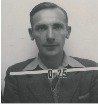
Figur 1: Józef Rotblat cirka 1944. Fotot är fråns hans ID-bricka vid Los Alamos, då han medverkade i Manhattanprojektet, vilket han senare lämnade.

nya instrument för att utforska kärnornas inre konstruerades och strålning kunde detekteras som alfa, beta och gammastrålning 1 . Det var stora framsteg inom den grundläggande forskningen vid många laboratorier i Europa. Både teoretisk och experimentell kärnfysikforskning gav häpnadsväckande resultat som skulle få stora konsekvenser för mänskligheten, bland annat inom medicin, säkerhet, energi, material med mera. År 1939 kom den stora upptäckten: atomkärnorna fissionerar. Upptäckten offentliggjordes och USA började undra hur mycket av denna forskning som bedrevs i nazi-Tyskland.