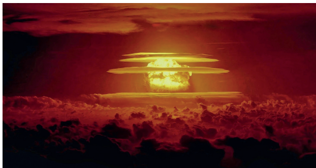
Figur 2: BRAVO-testet, det första vätebombtestet USA gjorde i Bikini-atollen, med en sprängkraft av cirka 15 megaton (ca 1000 ggr kraftfullare än Hiroshimabomben). Radioaktiva nedfallet drevs av vindar över till Japan.

evenemang på Royal Academy, där Russell höll föredrag om den fara för mänskligheten som det nya massförstörelsevapnet innebar. Provsprängningen Bravo (se figur 2) genomfördes 1954 och det började bli uppenbart för många vetenskapsmän att denna utveckling var ett hot mot mänsklighetens överlevnad.